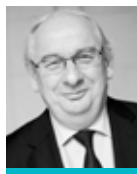
Michel DELEBARRE Sénateur-Maire de Dunkerque